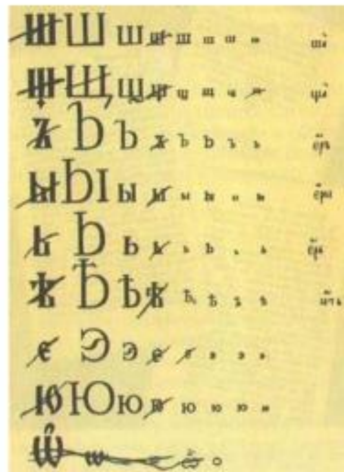
Правка алфавита Петром I

На протяжении 1000 лет кириллица несколько раз видоизменялась. В России этот алфавит прошел через шесть реформ, важнейшими из которых были реформы Петра I. Он упростил азбуку. Петр I оставил старое написание букв в церковных книгах, а в книгах и документах ввел гражданский шрифт, близкий к современному и состоявший из 36 букв.