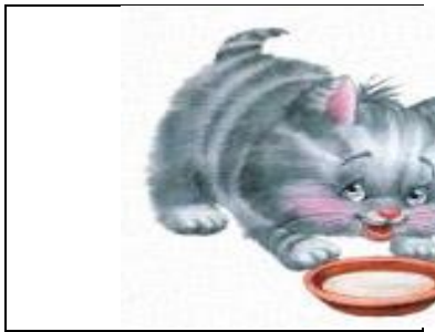
«Котенок пьет молоко» (Рис.1)

Для детей младшего дошкольного возраста первым этапом обучения являются мнемоквадраты. Такая картинка представляет собой нанесенное изображение, которое обозначает одно слово или словосочетание (Рис.1)