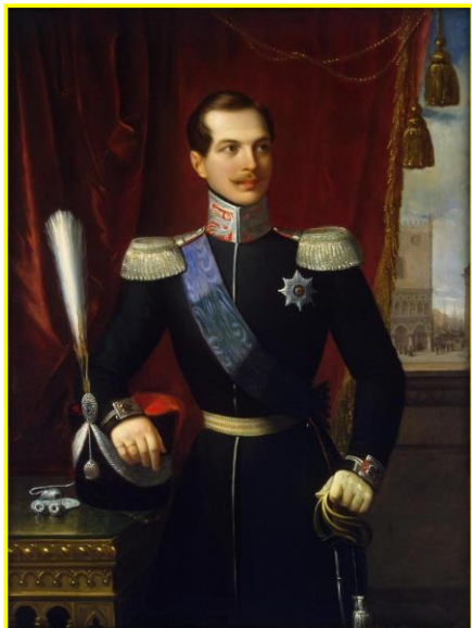
Александр Николаевич Луцкий

На култуминских рудниках отбывали каторгу два декабриста — барон Вениамин Николаевич Соловьёв, штабс-капитан Черниговского полка, и Александр Николаевич Луцкий, направленный сюда в 1838 году.