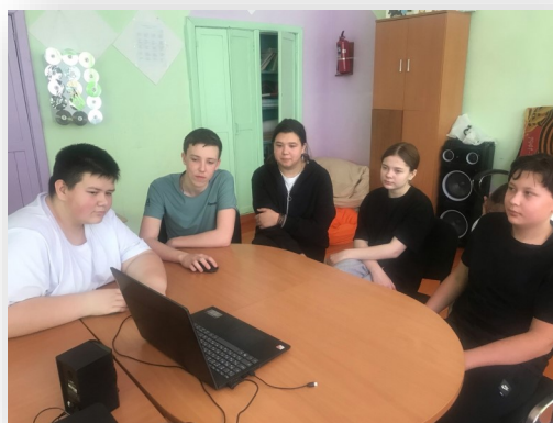
Команда Солонечнинской СОШ