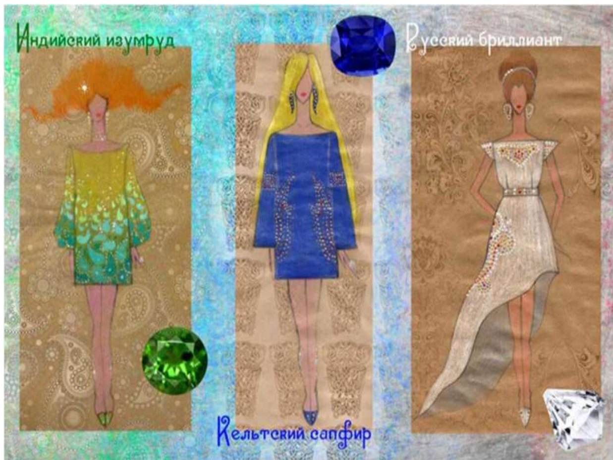
Рисунок 3 - Эскизы моделей. Автор Кузнецова Алина. 2013 г.