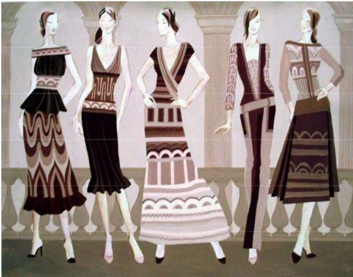
Рисунок 1 - Разработка коллекции из трикотажа «АрхиТрик». Автор Дьячкова Татьяна