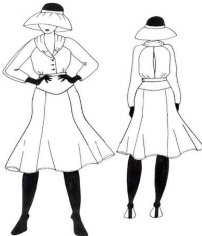
Рис. 1 - Рисунок модели костюма Ссылка в тексте работы

При работе и использовании в проекте нормативных правовых актов, научной литературы, периодических изданий и т.д. необходимо давать ссылку на соответствующий источник . Количество ссылок на информационные источники и разнообразие этих источников - показатель умения автора работать с информацией.